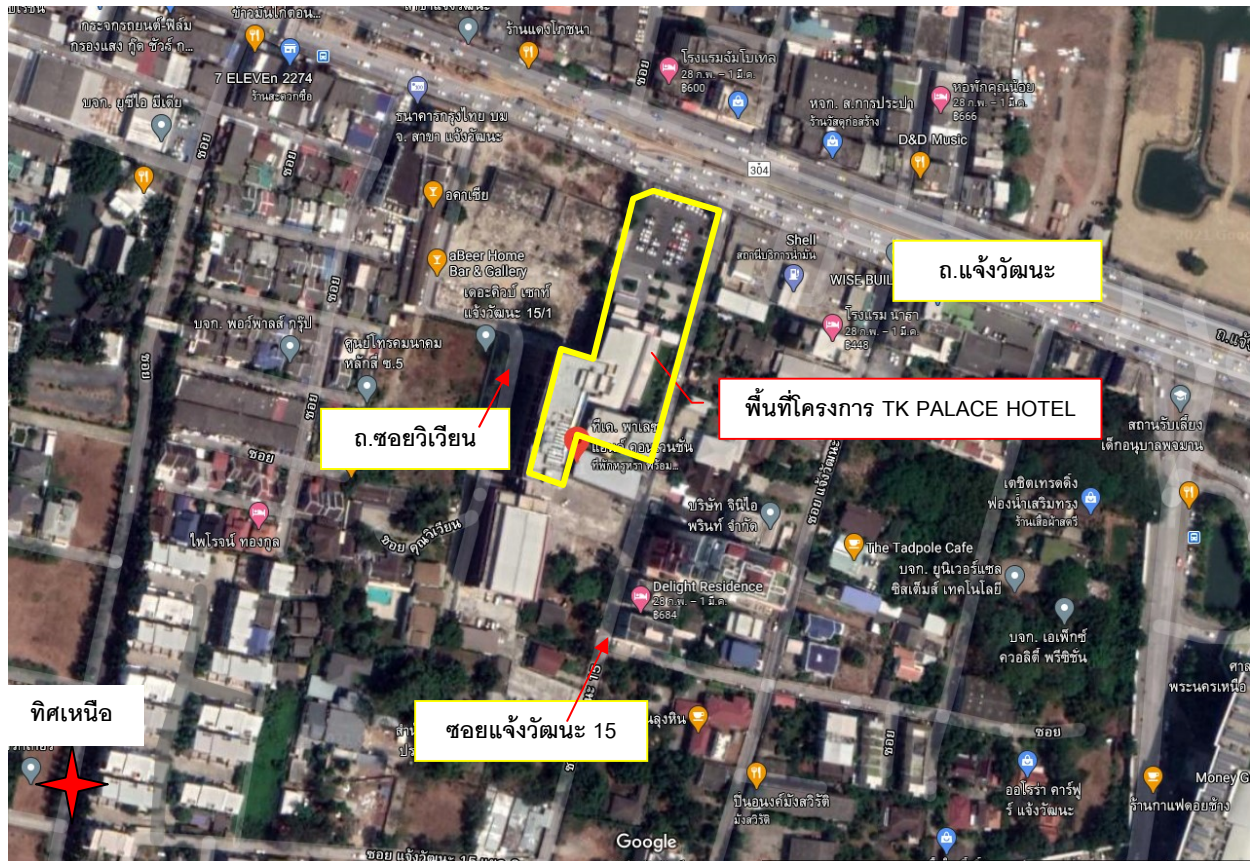
ภาพที่ 1 จุดที่ตั้งพื้นที่โครงการ

ทิศตะวันออก ติดกับ ถัดไปเป็นบ้านพักอาศัย สูง 2 ชั้น พื้นที่อาคารโรงงานปิดกิจการ สูง 2 ชั้น อยู่ระหว่างปรับปรุงเป็น ตลาดถนนซอยคุณวิเวียน(ถนนการะจำยอม)เขตทางกว้าง 8ม.